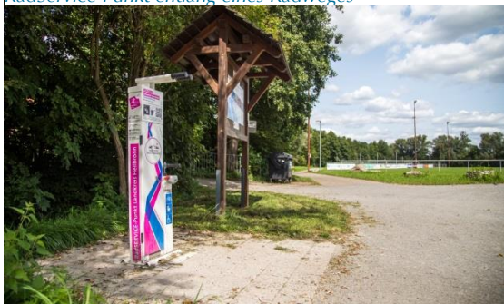
RadService-Punkt entlang eines Radweges